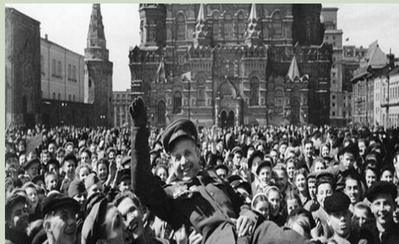
Первый День Победы 9 мая 1945 г.

Документ о капитуляции Германии был подписан в Берлине 8 мая в 22 часа 43 минуты по местному времени. Поздно ночью он был доставлен в Москву. И уже в 2 часа 10 минут по московскому времени советское радио сообщило о победе в Великой Отечественной войне. Диктор Юрий Левитан прочел Акт о военной капитуляции фашистской Германии и Указ Президиума Верховного Совета СССР об объявлении 9 мая днем всенародного торжества – и присвоении ему статуса выходного дня. В Москве в этот день состоялся Салют Победы: было дано 30 залпов из зенитных орудий. В городах и селах проводились стихийные митинги, на которых присутствовало множество людей. Праздновали первый День Победы 9 мая 1945 года, с ночи до утра, еще пока без праздничного Парада Победы. Первый парад в честь победы СССР в Великой Отечественной войне, к которому готовились полтора месяца, состоялся 24 июня 1945 года на Красной площади в Москве. Им командовал маршал Константин Рокоссовский, а принимал его маршал Георгий Жуков. В параде принимали участие 24 маршала, 249 генералов, 2 536 офицеров и 31 116 рядовых и сержантов. Кроме того