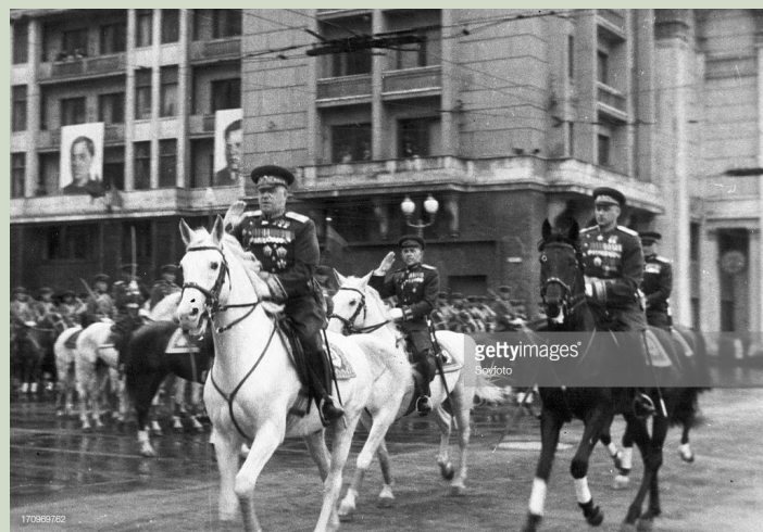
Маршал Советского Союза Жуков принимает Парад Победы в 1945 году.