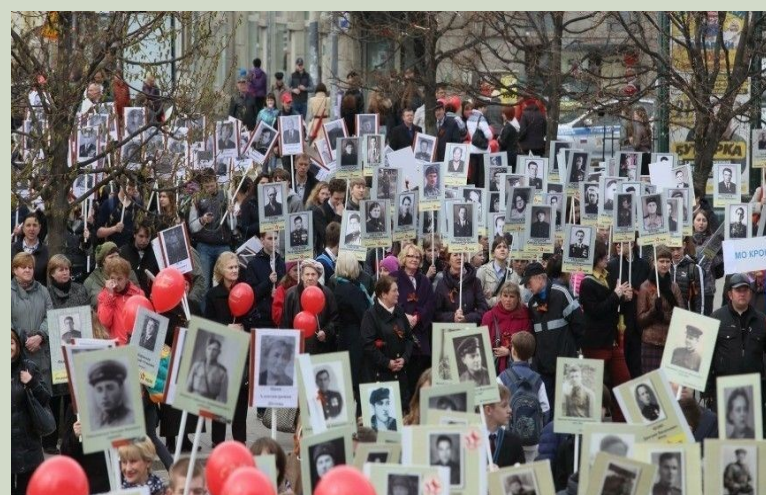
Парад Победы в наши дни

зрителям показали 1850 единиц боевой техники. В конце парада 200 немецких знамен были брошены к подножию Мавзолея как символ победы над врагом. В других городах страны 24 июня состоялись праздничные салюты. Демобилизованные военнослужащие, которые в июне месяце стали возвращаться домой, могли принять