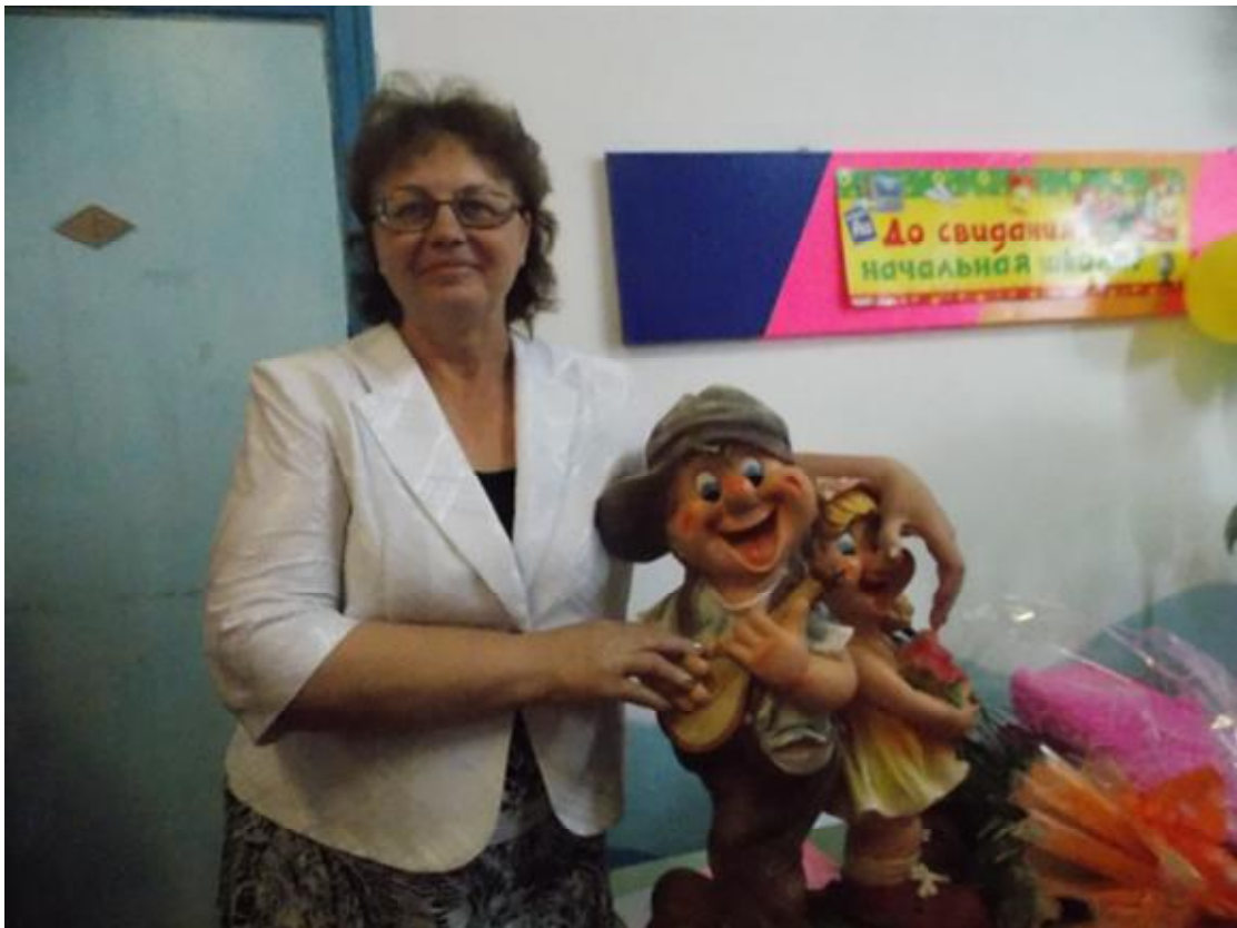
Ученик 5 «А» класса